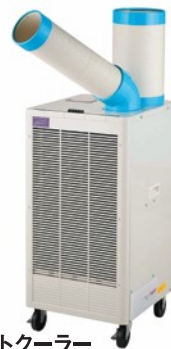
■スポットクーラー N407R