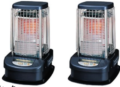
■ブルーヒーター GH-B190F GH-B196F

■ ブルーヒーター ■ ファンヒーター ■ ペアリングヒーター ■ スポットクーラー ■ ウインドクーラー