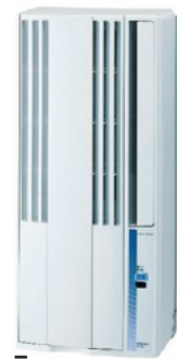
■ウインドクーラー CW-166R